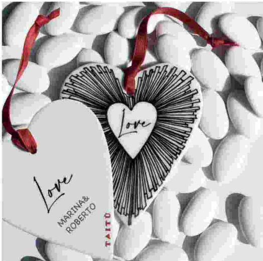
TAITÙ MILANO, Home Feelings Collection, preziose decorazioni per la casa in finissima porcellana rifinite a mano, ideali anche come bomboniere ( www.taitu.it )