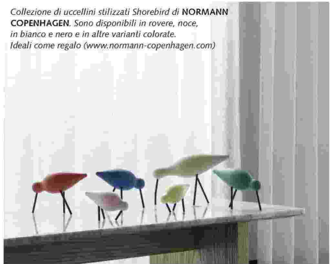
Collezione di uccellini stilizzati Shorebird di NORMANN COPENHAGEN. Sono disponibili in rovere, noce, in bianco e nero e in altre varianti colorate. Ideali come regalo ( www.normann-copenhagen.com )